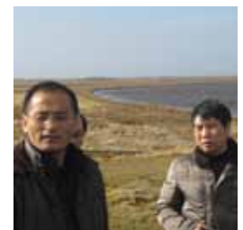
Kinesiske vandmiljøeksperter ved Varde Å

Økonomisk støtte til test- og demonstrationsprojekter i Kina, der udføres i samarbejde mellem danske og kinesiske virksomheder.